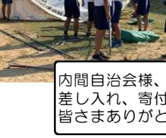
練習・準備・片付けもみんなががんばりました。